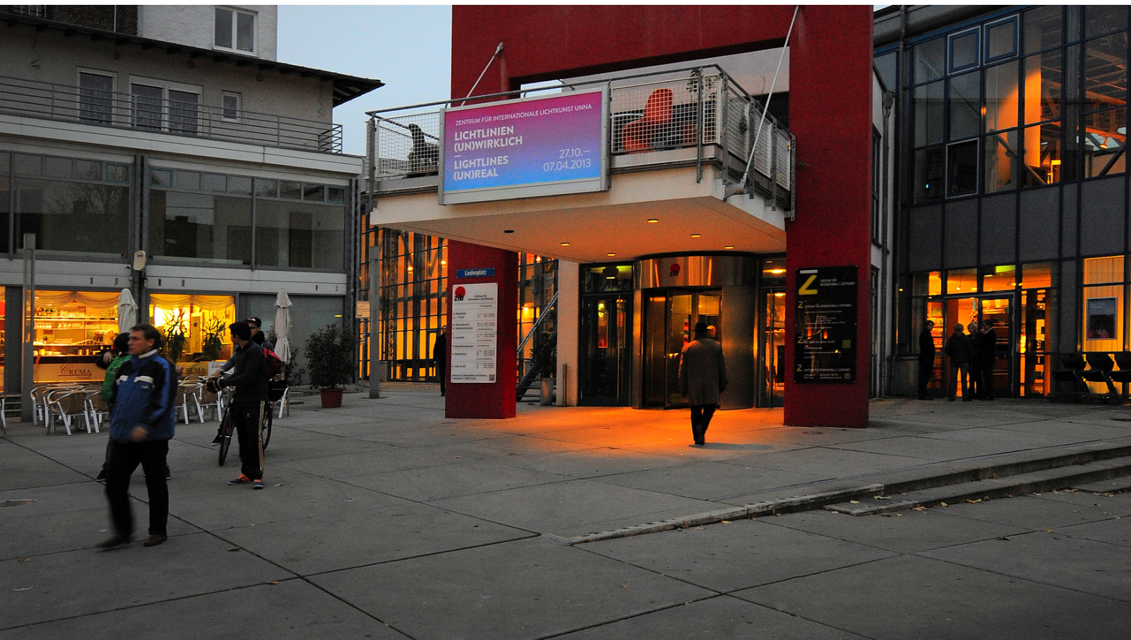
Ankerpunkt Lindenbrauerei Unna